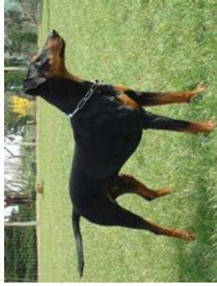
Sitt v. Bansow (Nr. 21) Kbs., Dt. Ch. VDH u. PSK, ISPU-Ksg.