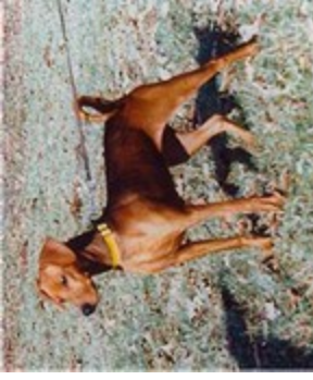
Candy v. Klosterfels (Nr. 10) Klub Sieger