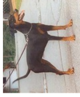
Dunja v. Klosterfels (Nr. 12) Ejsg. 2001, Kbs., Dt. Ch. PSK