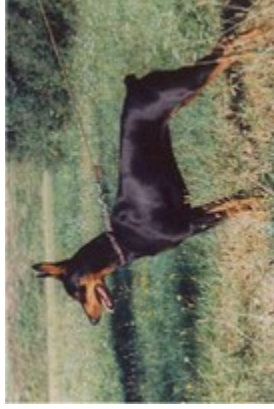
Moni v. Nordkristall (Nr. 3) Klub Sieger (Kbs)