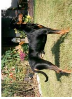
Santo v. Bansow (Nr. 22) Klubsiieger