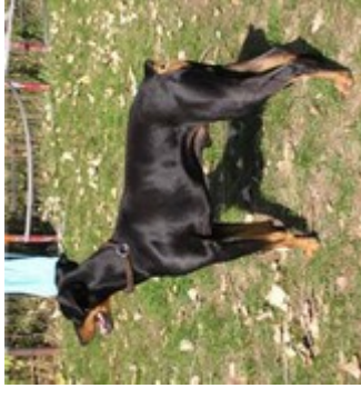
Very vom Nordkristall (Nr. 6) PSK-Agility-Sieger 2000