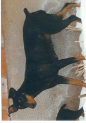
Peggi v. Nordkristall (Nr. 4)