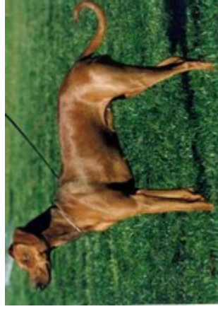
Wilma v. Nordkristall (Nr. 9) Bjsg 99, Kbs., Dt. Ch. VDH u. PSK, Bundessieger u. Europasisieger 2001