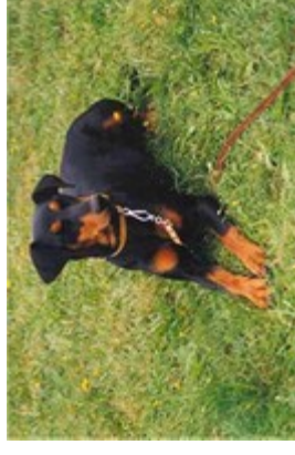
Svenja v. Bansow (Nr. 25)