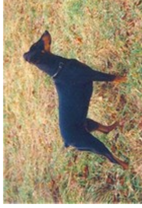
Netti v. Bansow (Nr. 15) Kbs., Dt. Ch. VDH u. PSK, Jsg-PSK 2000, ISPU-Ksg.