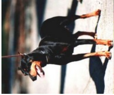
Linda v. Nordkristall (Nr. 1)