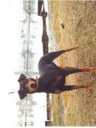
Jessi v. Bansow (Nr. 13)